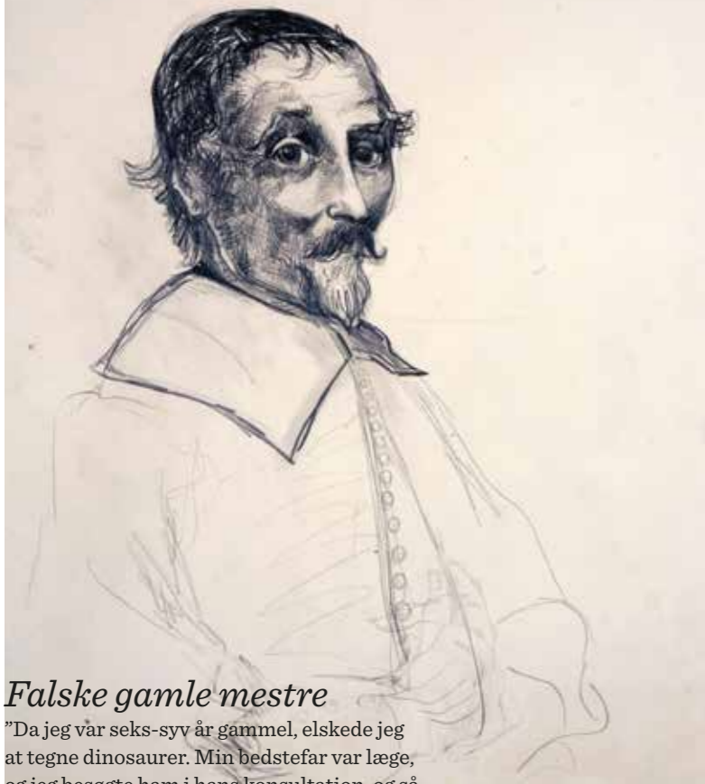
Old Master Composite 2, 1994 Graft på papir 65,1 x 50,2 cm