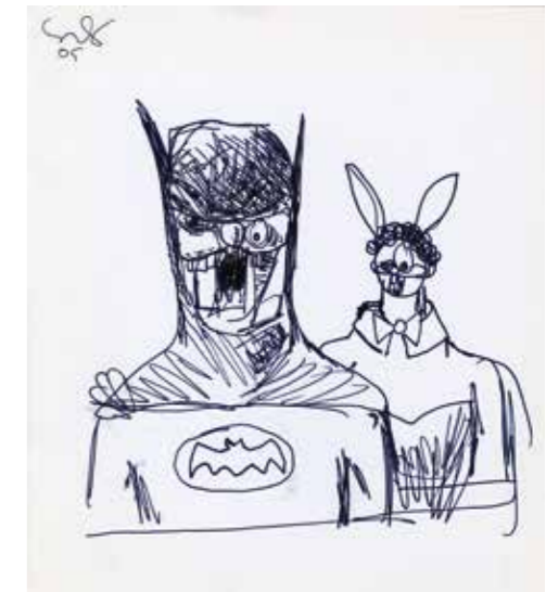
Batman and Bunny Study , 2005 Kuglepen på papir 24,1 x 19,7 cm

”Folk er til en vis grad personificeringer. Eller tegneserier er personificeringer af folk. Det gælder alle Loony Tunes-personerne og Snurre Snup og Daffy og alle dem, de tegnede abstraktioner, som vi viser nogle af på Louisiana: De er i virkeligheden realistiske mennesker og personificeringer af disse realistiske mennesker. Og hvad nu hvis vi går den anden vej? Hvad sker der, når tegneseriefigurene vender tilbage til dem, som de var personificeringer af? Og hvordan ser sådan en person ud efter at være begyndt som menneske for derefter at være blevet til en tegneseriefigur og have levet i den verden og siden være blevet menneske igen? Hvad har han forvandlet sig til? Ser han ud, som han gjorde før, eller har hans tegneserie-jeg transformeret ham til det, han er i dag?”