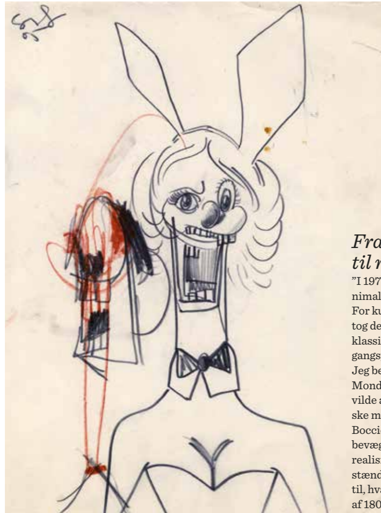
Playboy Bunny , 2005 Grafrit og farveblyant på papir 38,1 x 29,2 cm