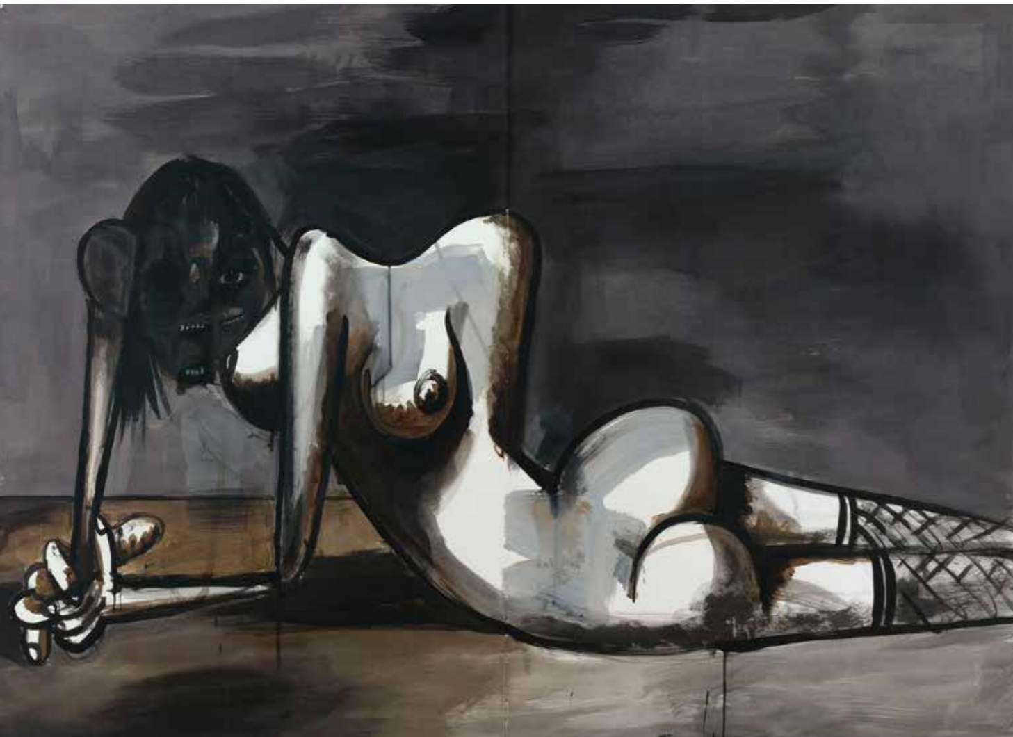
The Discarded Human , 2013 Blæk og kul på papir 153,8 x 210 cm

”Jeg har også altid holdt meget af den måde, Ed Ruscha brugte tegneseriesproget på i sine tidlige malerier, og af Warhols brug af det, da han lavede Skipper Skræk og Superman ... det var en stor pop-markering at indføre det sprog. Jeg tror, at det interessante ved det er, at det er en indgang til et alvorligt element i den menneskelige psyke, som åbner folks sind for en seriøs måde at se på tingene på, samtidig med at de måske også får noget sjovt ud af det. Ligesom Goyas Sorte Billeder – hvor grufulde de end er, kan folk ikke lade være med at smile og le, når de ser dem, for de er bare så langt ude, at de kalder smilet frem. Noget af det, der foregår på de billeder, er virkelig afsindig humoristisk. Det er sådan, jeg oplever dem.”