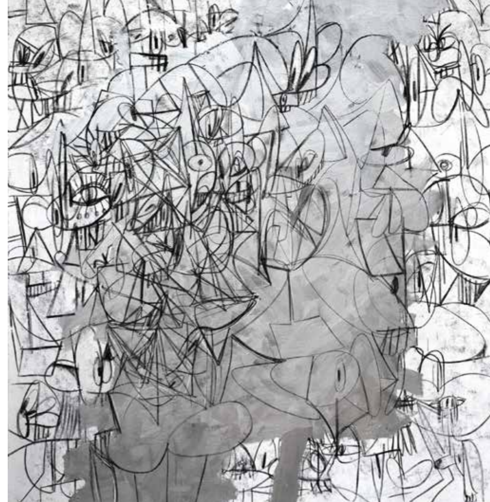
Silver Mass, 2014 Akryl, kul, metallisk maling og pastel på lærred 203,2 x 193 cm