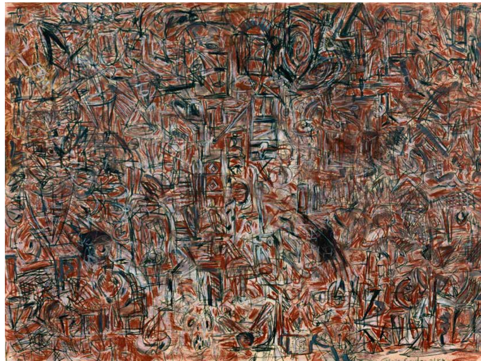
Jazz Composition, 1982 Kul og pastel på papir 56,5 x 76,3 cm

Jeg kan godt lide at arbejde hurtigt. Jeg kan ikke se, hvorfor det skal tage så lang tid at lave en tegning. Grundlæggende arbejder man jo, ligesom en violinist spiller på sit instrument. Først kommer der måske en langsom sats, en sarabande eller sådan noget, og så kommer der en presto vivace. Men man må ikke forfejle en eneste tone i nogen af dem. Tempoet er altså meget vigtigt i al kunst. Jeg mener, at noget kunst har et meget langsomt tempo, og noget kunst har et meget højt tempo. Men når man står og ser på et værk, der ser ud, som om det har et højt tempo, er det svært at vide, om det i virkeligheden blev lavet meget langsomt, eller om det faktisk blev skabt meget hurtigt.”