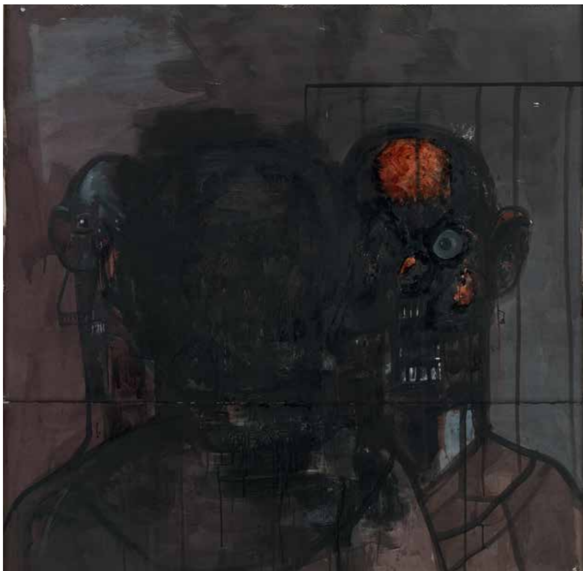
The Prisoner, 2013 Blæk og gesso på papir 159,4 x 159,2 cm

”I de dobbelthovede portrætter ser man en sommetider meget realistisk figur i profil ved siden af en meget abstrakt kubistisk figur. Eller man ser sådan noget som værket The Prisoner , som vi viser på udstillingen, hvor figuren har et virkelig uhyggeligt ansigt og er lukket inde i en slags bur. Og i forgrunden ses hans egen skygge, der stirrer på den, han er i dag. Det er en slags eksistentiel situation: Enten er det skyggen, der er den virkelige ham, eller også er det fremstillingen af ham, der er den virkelige ham. En af delene.”