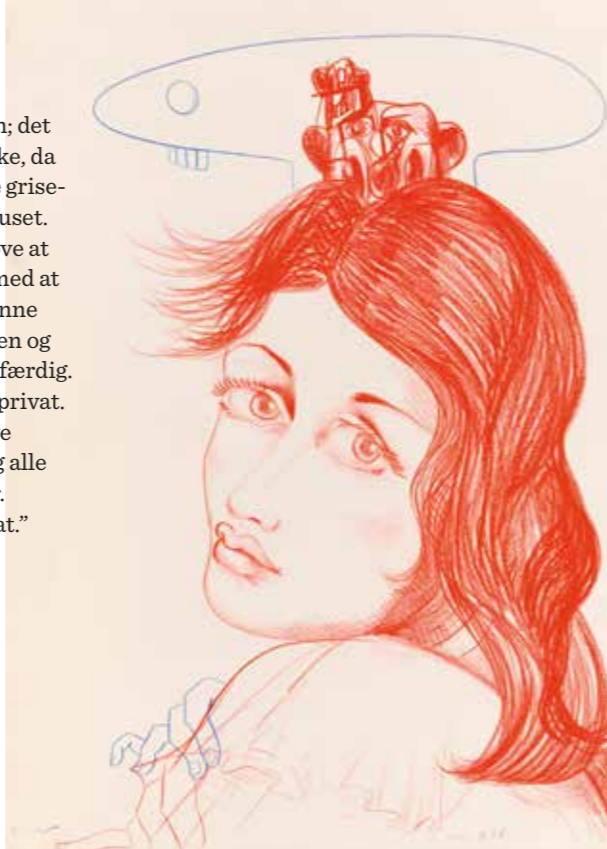
Mental Sketch 1, 2004 Farveblyant på papir 66,1 x 48,3 cm

”Det er nok noget, der går tilbage til barndommen; det er en renere måde at skabe kunst på. Jeg kan huske, da jeg fik mine første oliefarver. Det var noget værre grise-ri. Der var terpentint og olie og maling over hele huset. Mine forældre sagde hele tiden: ”Kan du ikke prøve at holde det inde på dit værelse? Prøv at lade være med at sprede det over hele huset.” Når man tegnede, kunne man have en blok, tegne en tegning i den, lukke den og lægge den ned i skrivebordsskuffen, når man var færdig. Der var ingen, der fik den at se; det er langt mere privat. Når man maler, er man til gengæld nødt til at have lærredet stående fremme, det skal stå og tørre, og alle og enhver kan komme forbi og se, hvad man laver. Jeg har altid holdt af at tegne, fordi det er så privat.”