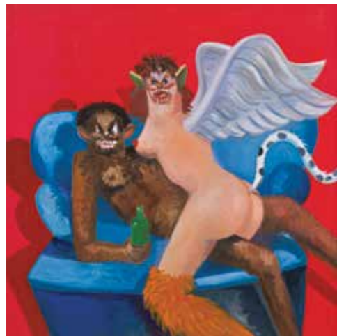
Phoenix , 2010 Olie på papir 121,9 x 121,9 cm

”En ting, jeg kan sige, er dog, at kunst er en af de sandfærdigste oplevelser – en af de sandfærdigste ting, vi har i verden i dag. Kunsten er sand, og alt andet er løgn.”